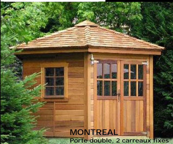
MONTREAL Porte double, 2 carreaux fixes