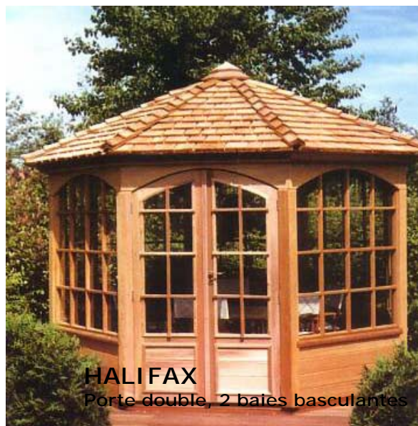
HALIFAX Porte double, 2 baies basculantes

Nos gloriettes sont hexagonales avec couverture en tuiles de Red Cedar. Les rives sont à 2,10 m et la pente de toit à 22°. La structure des gloriettes est en Red Cedar, le plancher est de type terrasse autoclave.